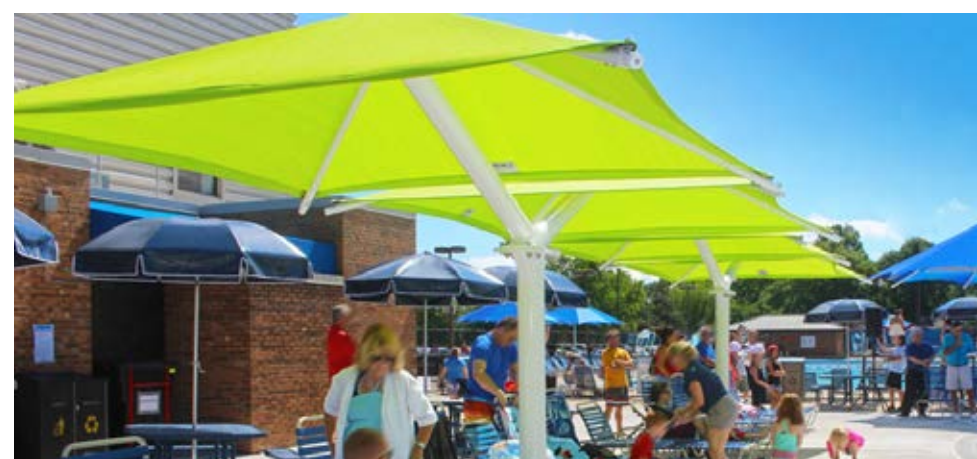
DOSP4242 – L'abri Double Offset Single Post (double pyramide à poteau décentré) 20' x 40', un poteau central, 2 toiles