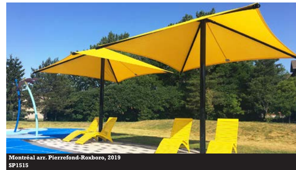
Montréal arr. Pierrefond-Roxboro, 2019 SP1515