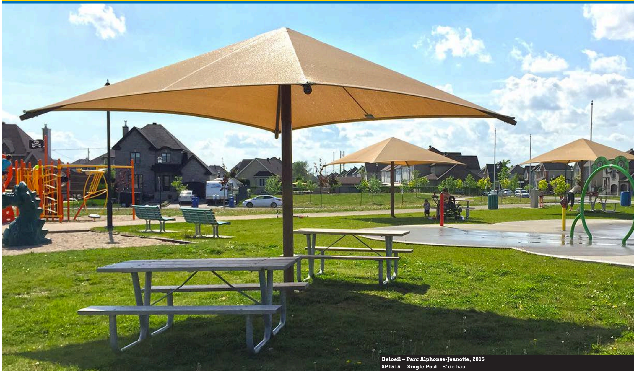
Beloeil – Parc Alphonse-Jeanotte, 2015 SP1515 – Single Post – 8' de haut