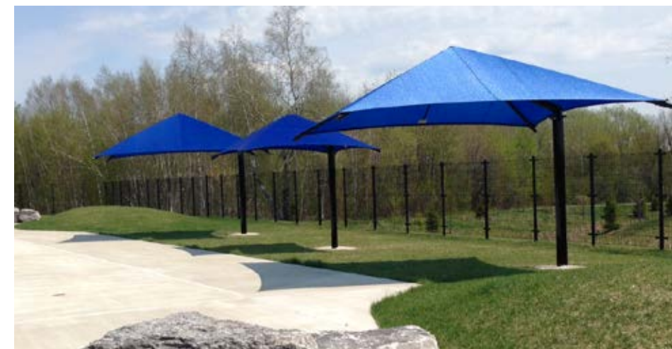
Beauport, piscine, 2016 OSP1515