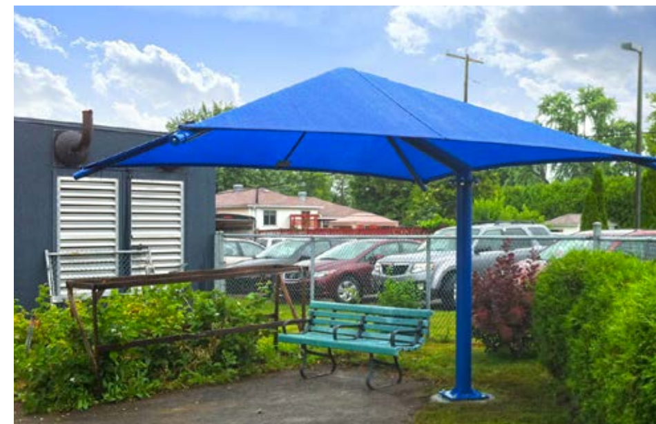
CLSC Sainte-Rose, 2014 OSP1212